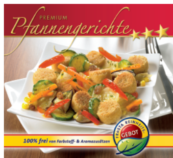
FROSTA Gemüse-Couscous »orientalisch«

Digitaler Text und digitale Fotos finden Sie im Presse-Bereich unter www.frosta-foodservice.de