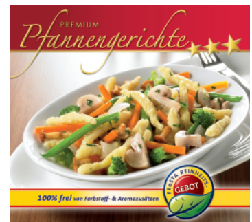
FROSTA Spätzle-Pilzpfanne »vegetarisch«

Abdruck honorarfrei – Belegexemplar erbeten.